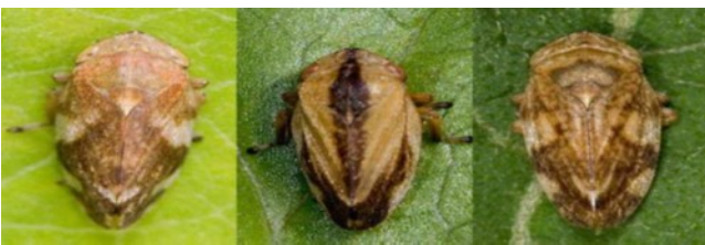
Fig. 5 Skumcikader Philaneus spumarius .

Bakterien spredes naturligt over korte afstande med insekter som f.eks. småcikader og skumcikader (fig. 5). Når de har suget saft fra en inficeret plante, kan de overføre bakterien til en rask plante. Over store afstande kan bakterien spredes ved handel og transport af inficerede planter.