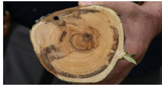
Fig. 6 Bakterien har tilstoppet si-vævet, der farves mørk

Bakterien kan ikke bekæmpes med pesticider, og angrebne planter skal derfor destrueres. For stiklinger og småplanter i hvile kan varmtvandsbehandling med 50° varmt vand i 45 minutter dræbe bakterien, uden at planten tager skade.