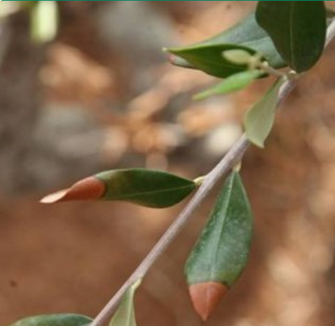
Fig. 1: Oliven med visne bladspidser afgrænset af rødbrun kant mod det friske væv.