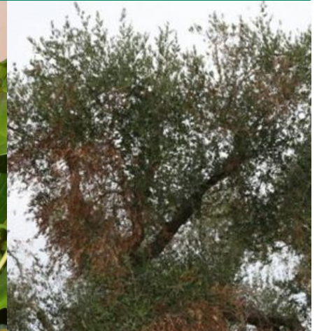
Fig. 3. Oliventræ med kraftigt angreb.