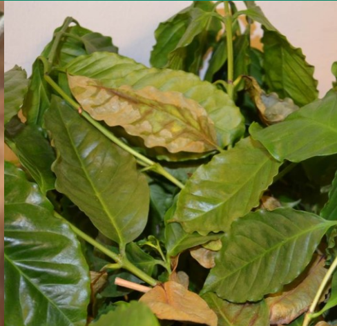
Fig. 2: Kaffeplante med visne og begyndende gulfarvning af blade.