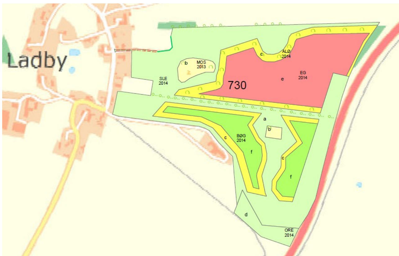
Skovrejsningsprojekt: Ladby Skov