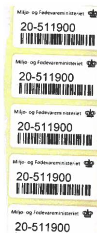
Figur 2: Eksempel på prøvetagnings- nummer.

Læs hvor og hvordan du journaliserer prøvetagningsrapporten i afsnit 6.