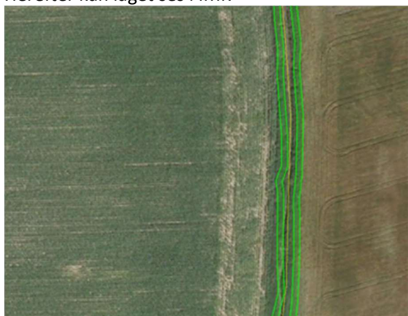
Figur 29. 2 meter bræmmelaget i IMK.

I forbindelse med KO-kontrolbesøget skal du kontrollere, om der er sket: